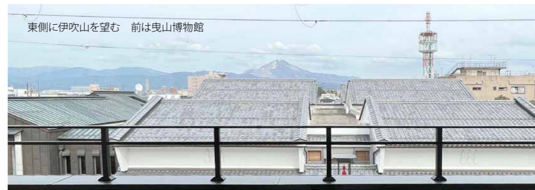
東側に伊吹山を望む 前は曳山博物館

長浜の中心部、元浜町 13 番街区の再開発で生まれたビルの 3 階にある新しいオフィスです。